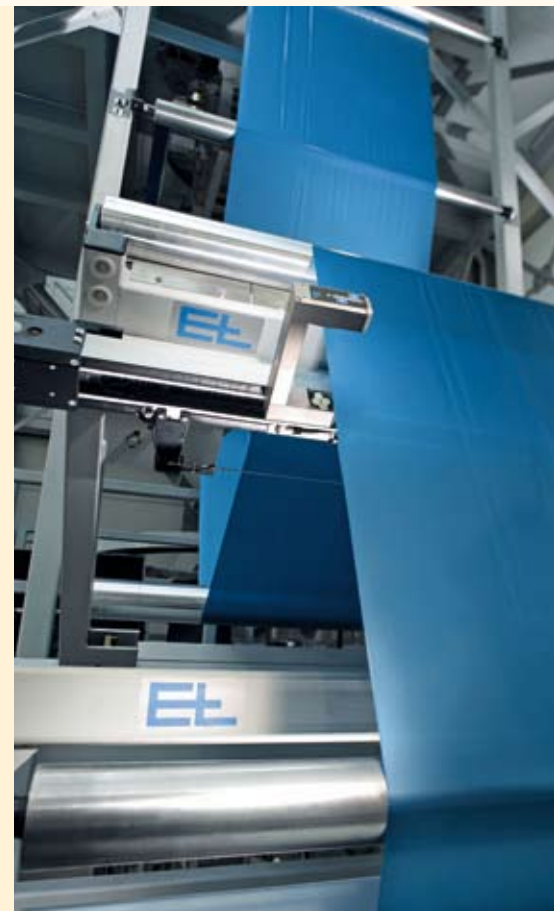
Systemlösungen für die Inspektions- und Automatisierungstechnik an laufenden Bahnen von E+L.