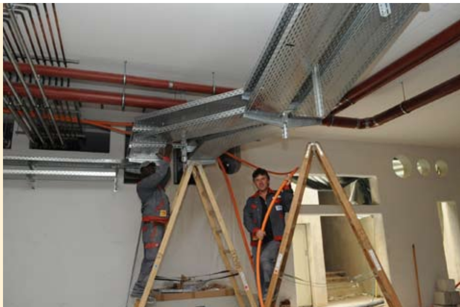
E+L Elektroanlagen gewährleistet qualitativ hochwertige Elektroinstallationsarbeiten.

Besonderen Wert legt man bei E+L Elektroanlagen auf qualifiziertes Personal, um den