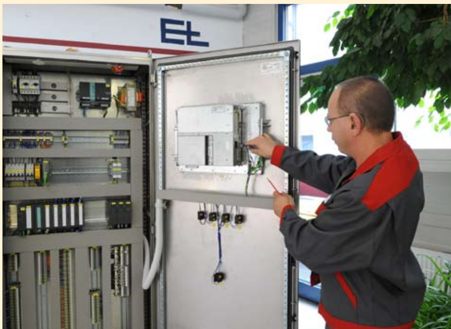
Zertifizierter Schaltanlagenbau nach neuestem Stand der Technik gehört zum Leistungsspektrum der Erhardt + Leimer CTE GmbH.